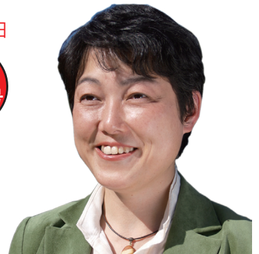
小金井市議会議員